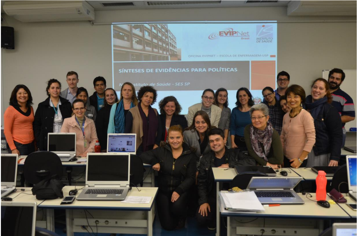
Foto oficial dos participantes e facilitadoras da oficina para capacitação nas ferramentas SUPPORT