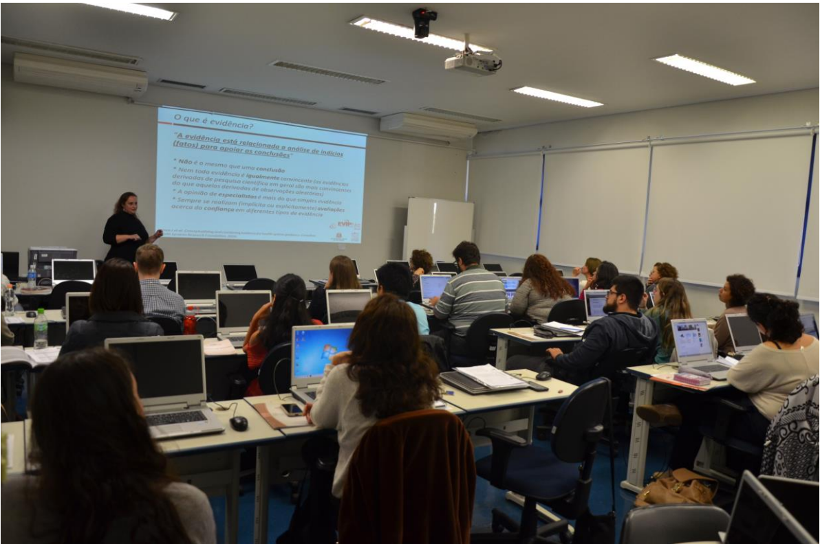
Facilitadora e participantes