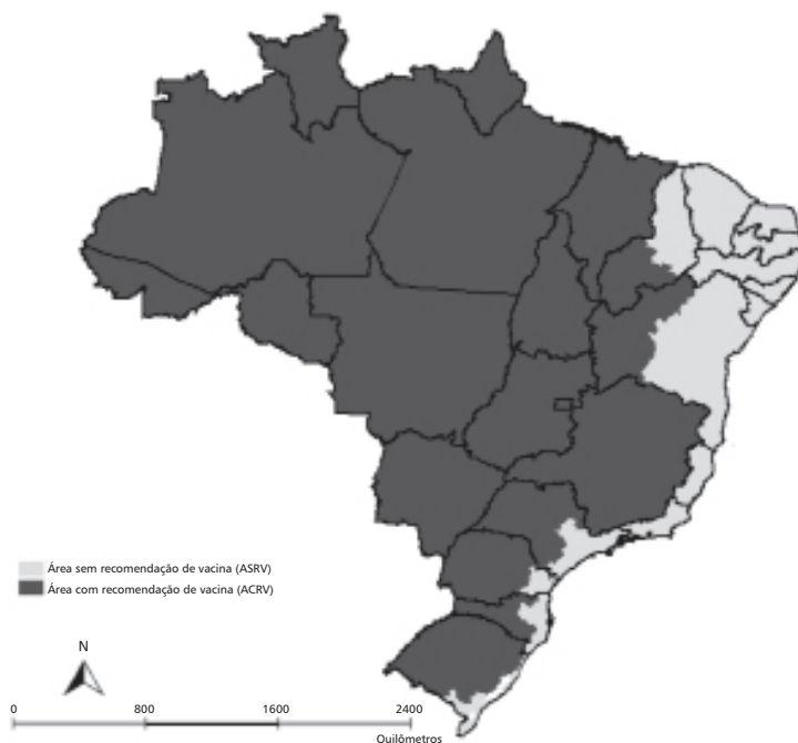
Figura 2 – Áreas com e sem recomendação de vacina de febre amarela no Brasil, 2012

Entre 2000 e 2008, observou-se uma expansão da circulação viral no sentido leste e sul do país, detectada em áreas classificadas há várias décadas como silenciosas. Em outubro de 2008, procedeu-se a uma nova delimitação, a qual levou em conta vários fatores: evidências da circulação viral, ecossistemas (bacias hidrográficas, vegetação), corredores ecológicos, trânsito de pessoas, tráfico de animais silvestres e critérios de ordem operacional e organização da rede de serviços de saúde que facilitassem procedimentos operacionais e logísticos nos municípios. Foram redefinidas, então, duas áreas no país: a) área com recomendação de vacina (ACRV), correspondendo àquelas anteriormente denominadas endêmica e de transição, com a inclusão do sul de Minas Gerais, até então considerada “área indene de risco potencial”; b) área sem recomendação de vacina (ASRV), correspondendo, basicamente, às “áreas indenes”, incluindo também o sul da Bahia e o norte do Espírito Santo, que antes eram consideradas “áreas indenes de risco potencial” (Figura 2).