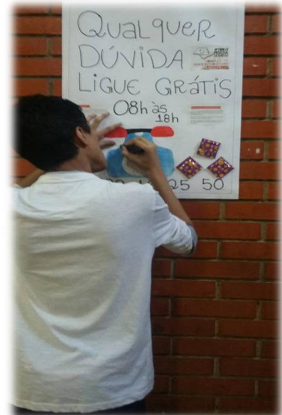
EE PARQUE PIRATININGA III – Itaquaquecetuba Cantinho da Prevenção