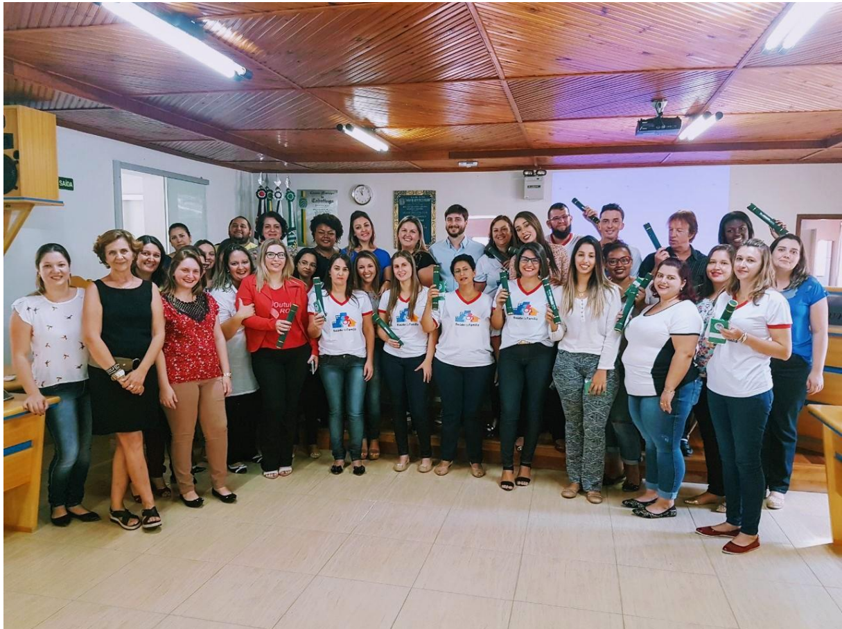
Figura 2 – Classe Descentralizada em Tabatinga

Finalização da Turma de Agente Comunitário de Saúde em Tabatinga e também pelos municípios de Ibatinga e Nova Europa, que aconteceu no dia 08 de maio de 2018. A turma foi formada por 24 alunos e ocorreu no período de 23/08/2017 a 09/03/2018.