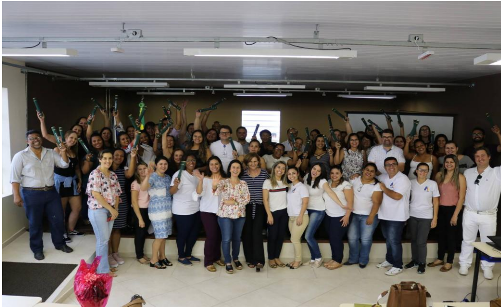
Figura 5 - Classe Descentralizada em Matão Turmas I e II