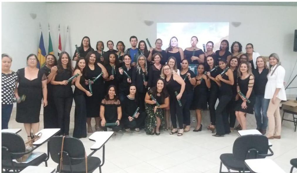
Figura 4- Classe Descentralizada em Morro Agudo

Parceria com as Secretarias Municipais de Saúde de Morro Agudo, Ipuã e Nuporanga A turma contou com 36 alunos aprovados. A turma iniciou em 26/10/2017 e finalizou em 25/05/2018.