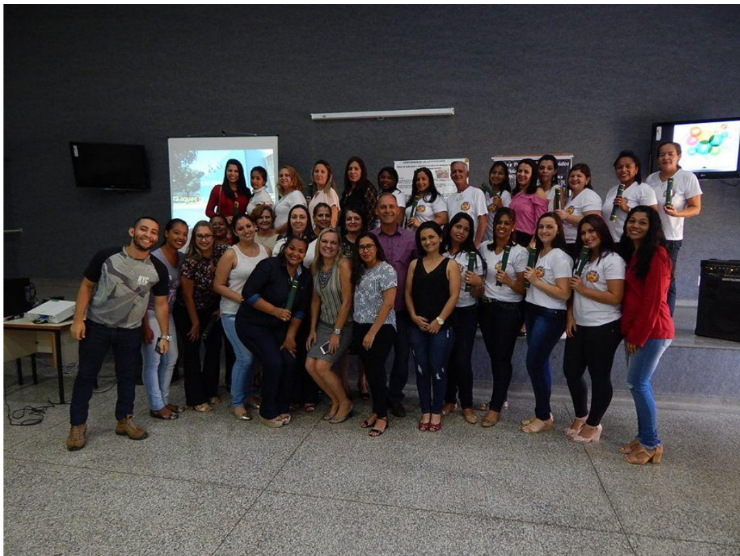
Figura 1- Classe Descentralizada em Santa Ernestina

Evento de finalização da turma de Agente Comunitário de Saúde em Santa Ernestina, composta também pelo município de Dobrada, que aconteceu na sede do CEFORSUS no dia 04 de maio de 2018.