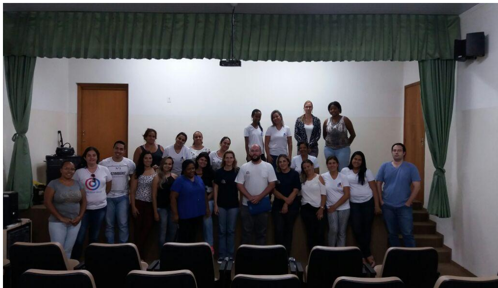
Figura 3- Classe Descentralizada em São Joaquim da Barra

Parceria com as Secretarias Municipais de Saúde de São Joaquim da Barra e Orlândia A turma contou com 29 alunos aprovados. A turma iniciou em 26/10/2017 e finalizou em 04/06/2018.