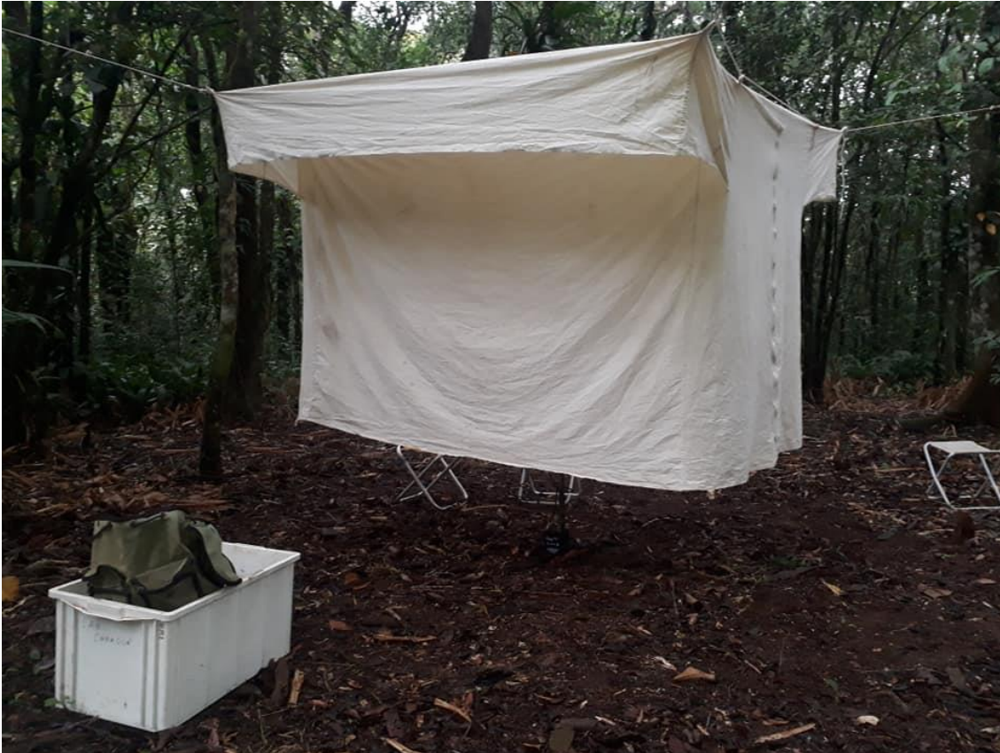
Fotografia 7: Barraca de Shannon

Centro Regional 3 – Taubaté Rua Alcaide Mor Camargo, nº 100 – Alto São João – Taubaté/SP – CEP 12010-240 Fone (12) 3632-7544/7583 - e-mail: sr03@sucen.sp.gov.br