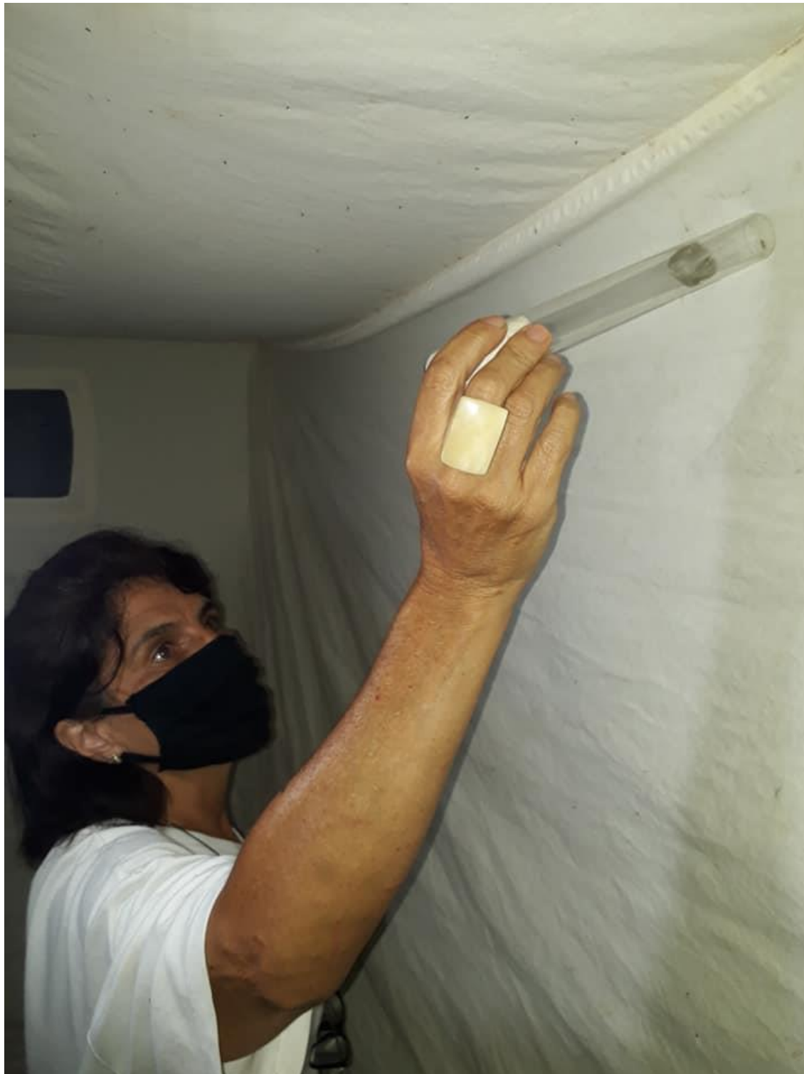
Fotografia 6: Utilização do Tubo Mortífero como método de captura

Centro Regional 3 – Taubaté Rua Alcaide Mor Camargo, nº 100 – Alto São João – Taubaté/SP – CEP 12010-240 Fone (12) 3632-7544/7583 - e-mail: sr03@sucen.sp.gov.br