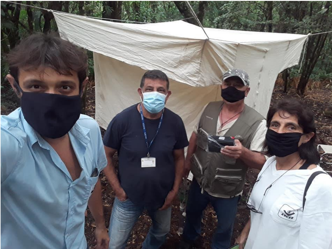
Fotografia 1: Equipe da SUCEN na execução da atividade de Pesquisa Entomológica

Pesquisa Entomológica de Malária na Barra do Una, São Sebastião, onde ocorreram três casos da doença no mês de agosto. Pesquisa realizada em 09 de setembro de 2020 pela SUCEN, com os métodos barraca de Shannon, CDC (Armadilha de Isca Luminosa), aspirador portátil e tubo mortífero. Todos os casos notificados de malária são acompanhados pela SUCEN e GVE, que orientam os municípios e indicam os procedimentos necessários para o tratamento e busca ativa de casos.