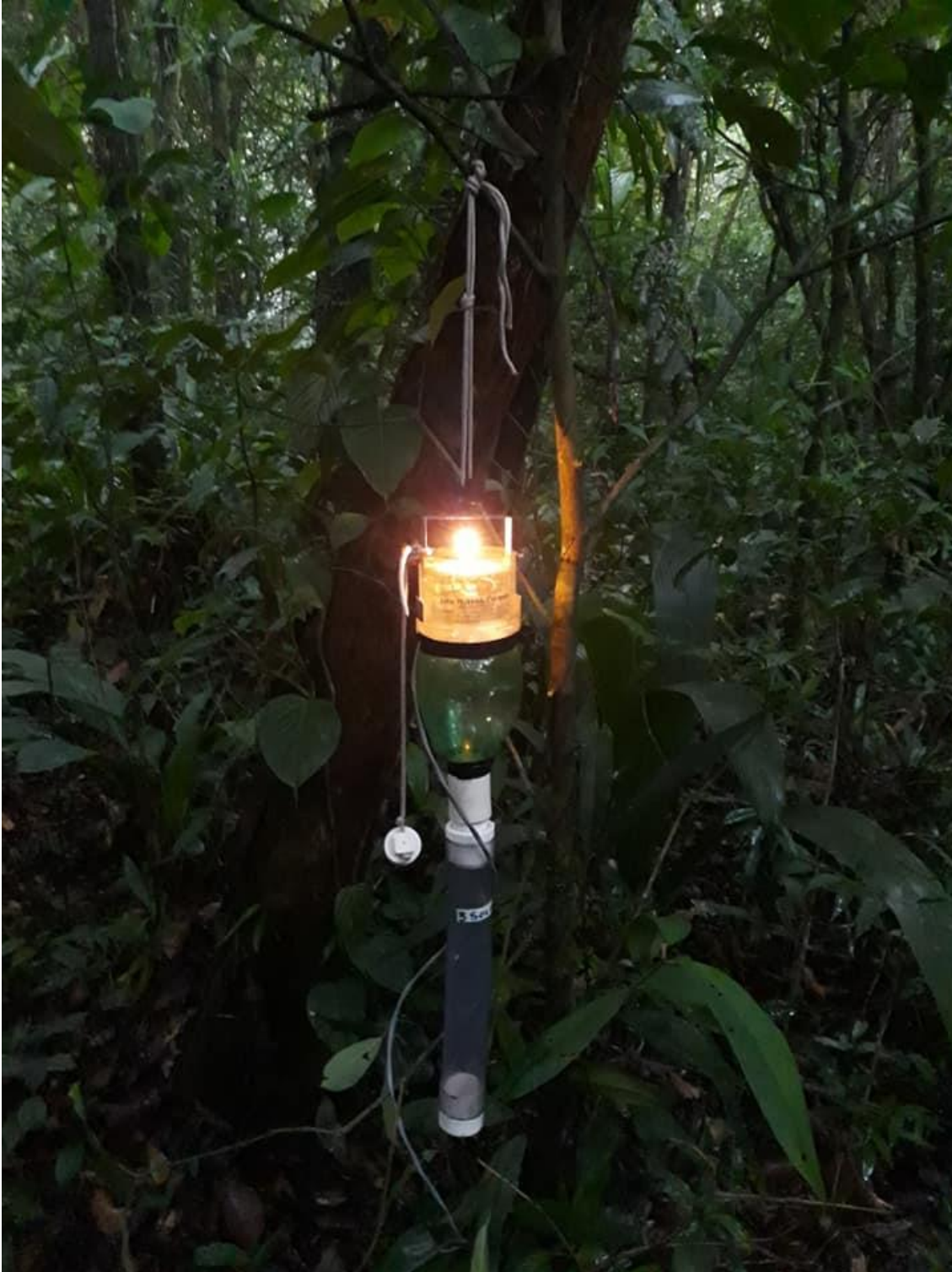
Fotografia 3: CDC – Armadilha de Isca Luminosa

Centro Regional 3 – Taubaté Rua Alcaide Mor Camargo, nº 100 – Alto São João – Taubaté/SP – CEP 12010-240 Fone (12) 3632-7544/7583 - e-mail: sr03@sucen.sp.gov.br