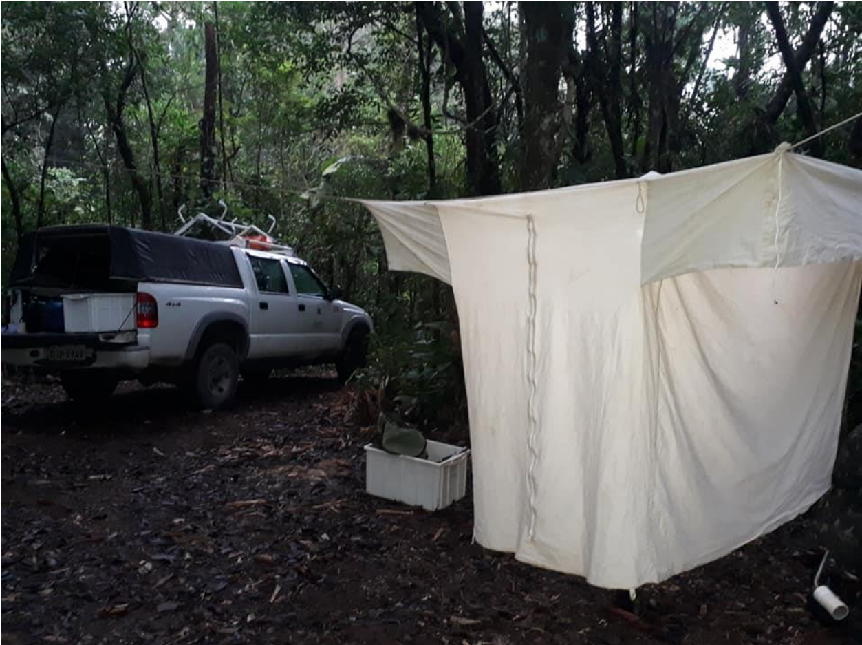
Fotografia 2: Barraca de Shannon

Centro Regional 3 – Taubaté Rua Alcaide Mor Camargo, nº 100 – Alto São João – Taubaté/SP – CEP 12010-240 Fone (12) 3632-7544/7583 - e-mail: sr03@sucen.sp.gov.br