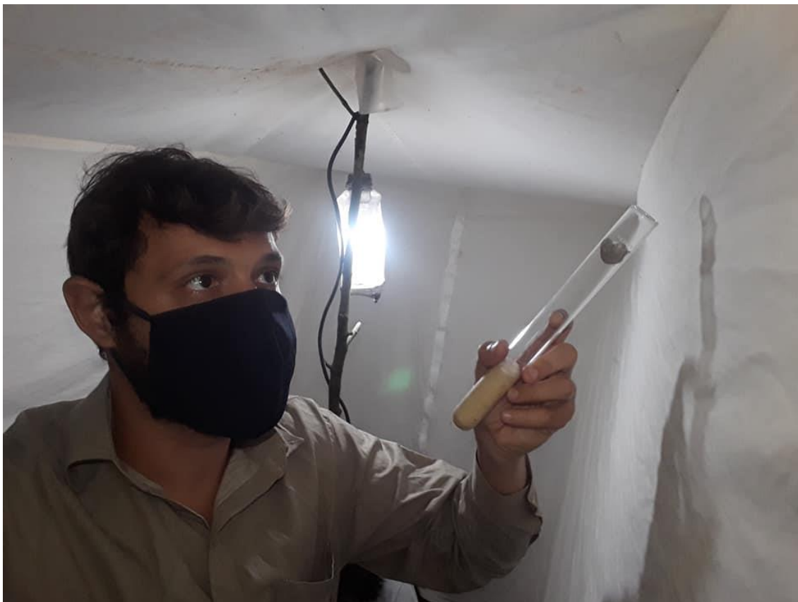
Fotografia 5: Utilização do Tubo Mortífero como método de captura

Centro Regional 3 – Taubaté Rua Alcaide Mor Camargo, nº 100 – Alto São João – Taubaté/SP – CEP 12010-240 Fone (12) 3632-7544/7583 - e-mail: sr03@sucen.sp.gov.br