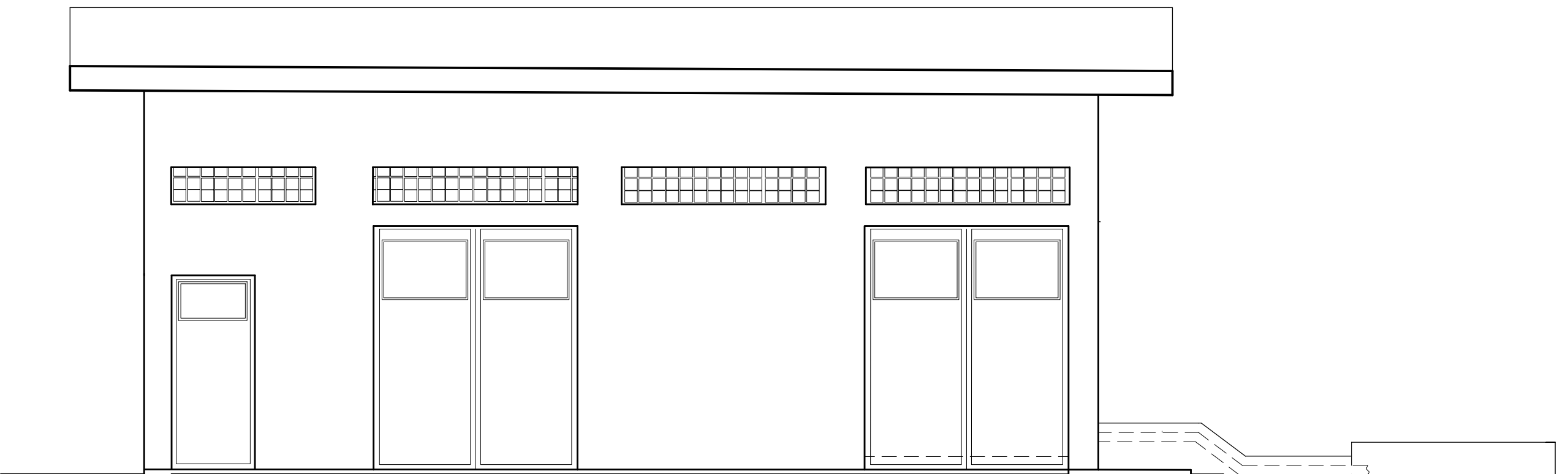
ELEVÇÃO A ESCALA : 1:50