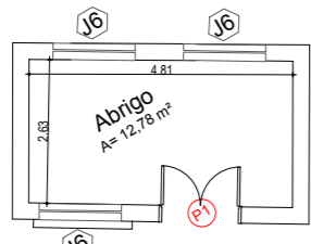
H04 - HOSPITAL - BLOCO D PLANTA BAIXA - TÉRREO

C09 - ABRIGO EXTERNO DE RESIDENTES PLANTA BAIXA - TÉRREO