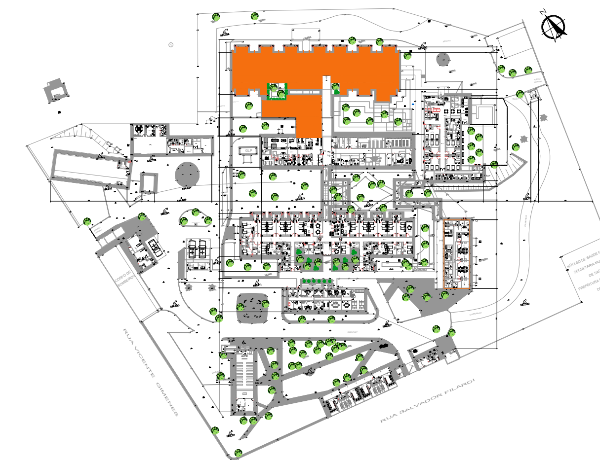
PLANTA DE LOCALIZAÇÃO