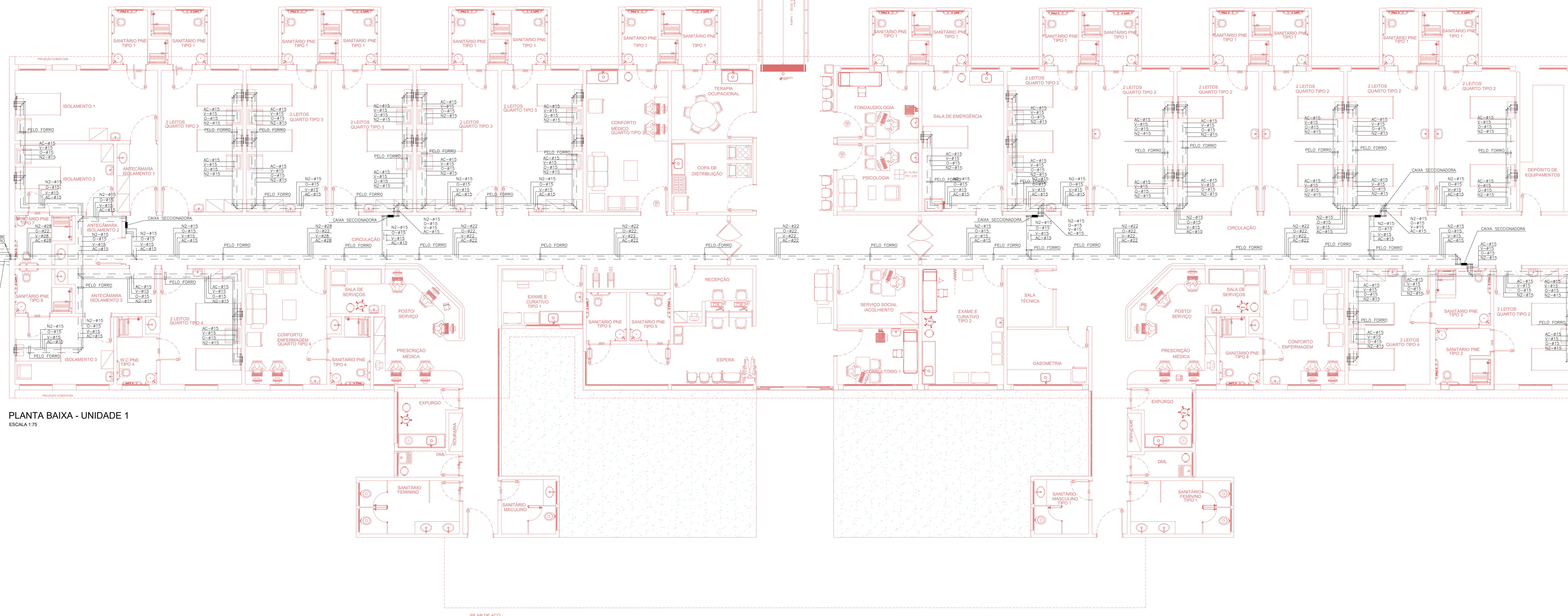
PLANTA BAIXA - UNIDADE 1 ESCALA 1:75