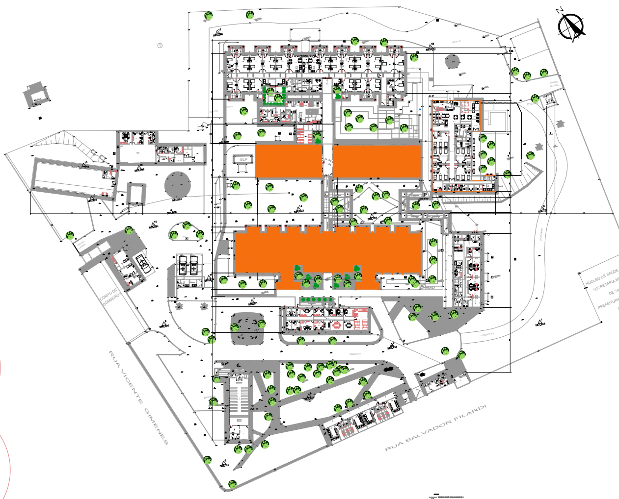
PLANTA DE LOCALIZAÇÃO