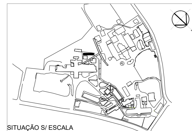
SITUAÇÃO S/ ESCALA

SÃO PAULO GOVERNO DO ESTADO Secretaria de Saúde