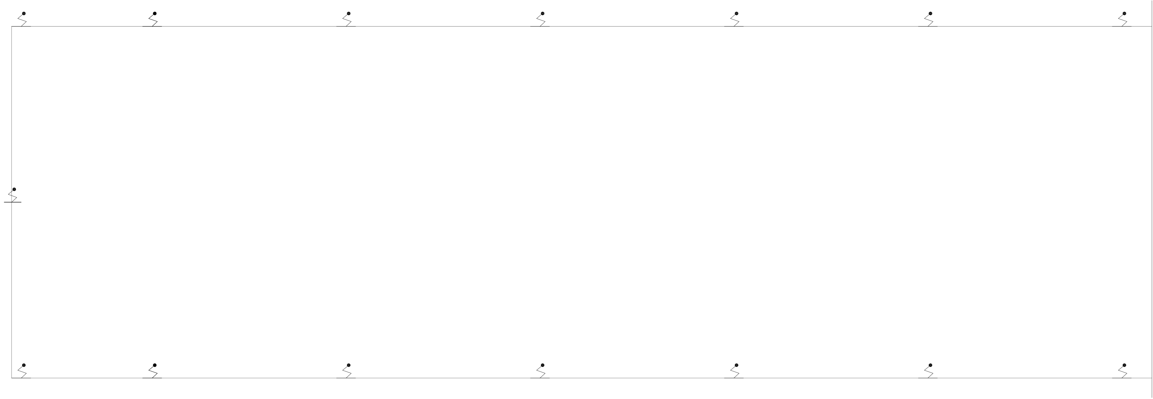
1 HOSPITAL GUILHERME ÁLVARO - EDIFÍCIO 11 PROJETO BÁSICO DOS SISTEMAS DE INCÊNDIO PLANTA BAIXA - PAVILHÃO DE SERVIÇOS ESCALA 1:100 METRO