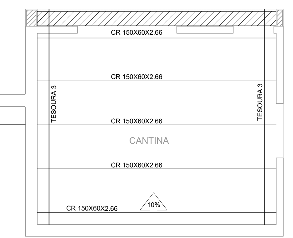
COBERTURA METÁLICA CANTINA ESCALA 1:50