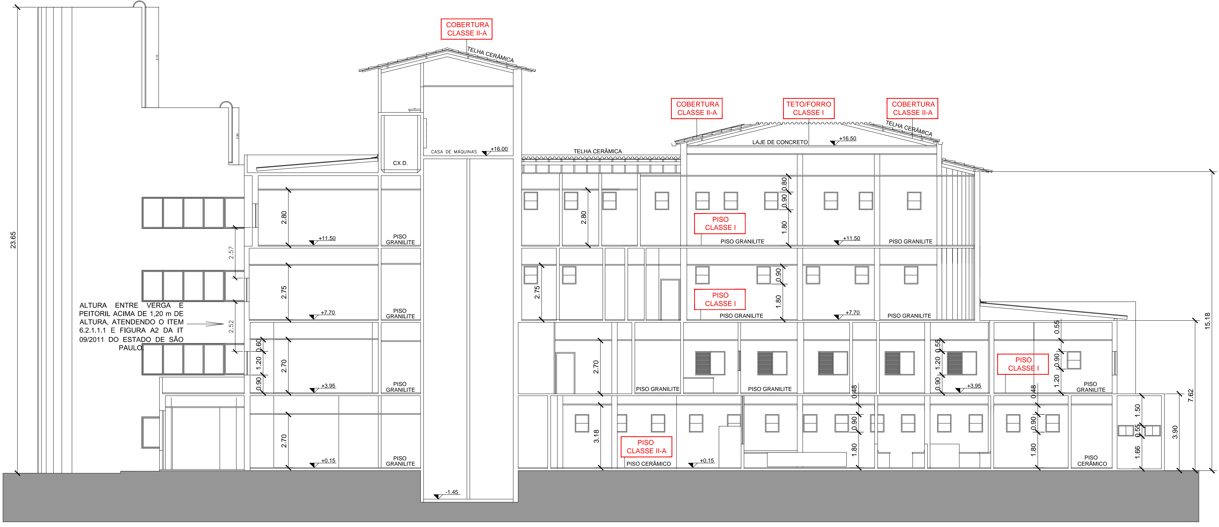
EDIFICAÇÃO 01 PRÉDIO HOSPITALAR CORTE C-C ESCALA 1:100

GPS ENGENHARIA AMBIENTAL E SEG. DO TRABALHO AVENIDA JAPÃO, Nº 1941, VILA BRASILEIRA - MOGI DAS CRUZES - SP TEL: (11) 3374-1044