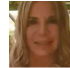
Lady Virginia CETESB Coordenadora

O controle e a vigilância de substâncias químicas em produtos e artigos