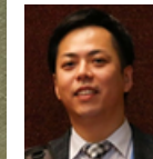
Takafumi Anan SECRETARIADO DA CONVENÇÃO DE MINAMATA - UNEP/ONU Conferencista

Link de acesso: https://zoom.us/j/92039761884? pwd=SHFZR1dGa0ppMmE1dGdTL3NGMFhiUT09