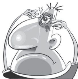
Icterícia (olhos e pele amarelos), fezes claras, urina escura.