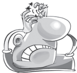
Dor de cabeça