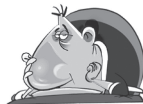
Cansaço, fraqueza e falta de apetite