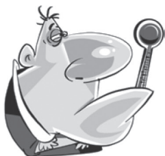
Febre e calafrios