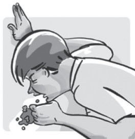
Diarréia, náuseas e vômitos