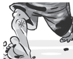
Dor nos músculos ou dor no corpo.