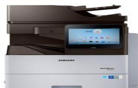
Samsung 5370 SL-M5370LX