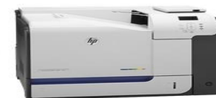
HP Laserjet Color M551DN