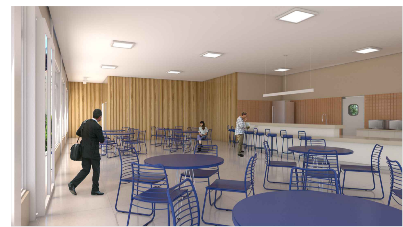
VISTA 3D - LANCHONETE