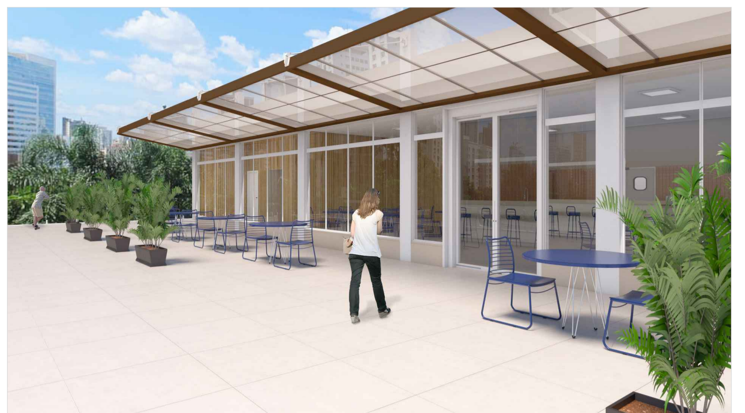
VISTA 3D - TERRAÇO