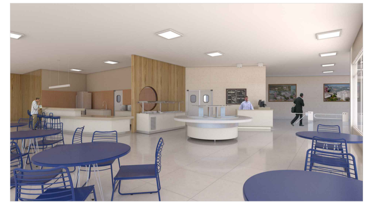
VISTA 3D - LANCHONETE E BUFFET