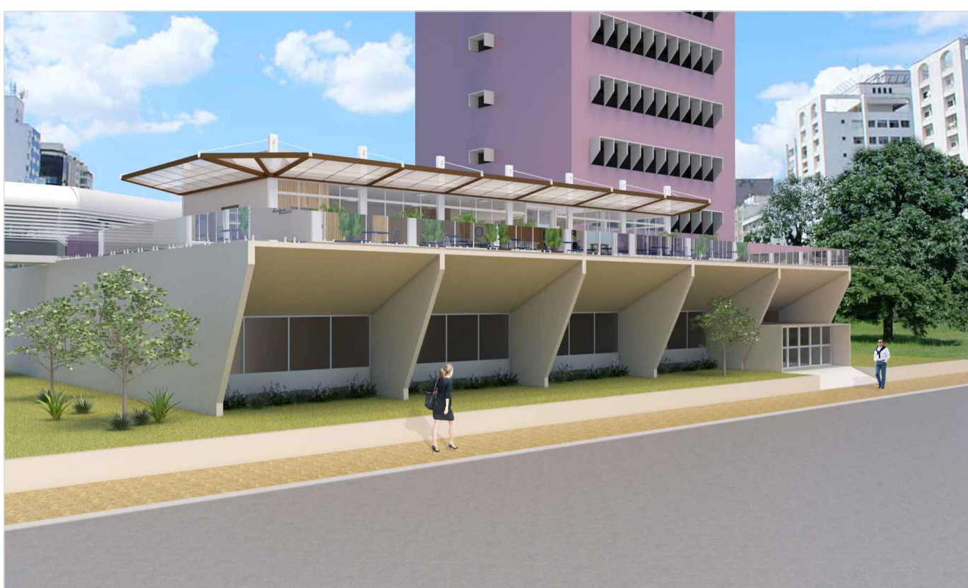
VISTA 3D - EXTERNA