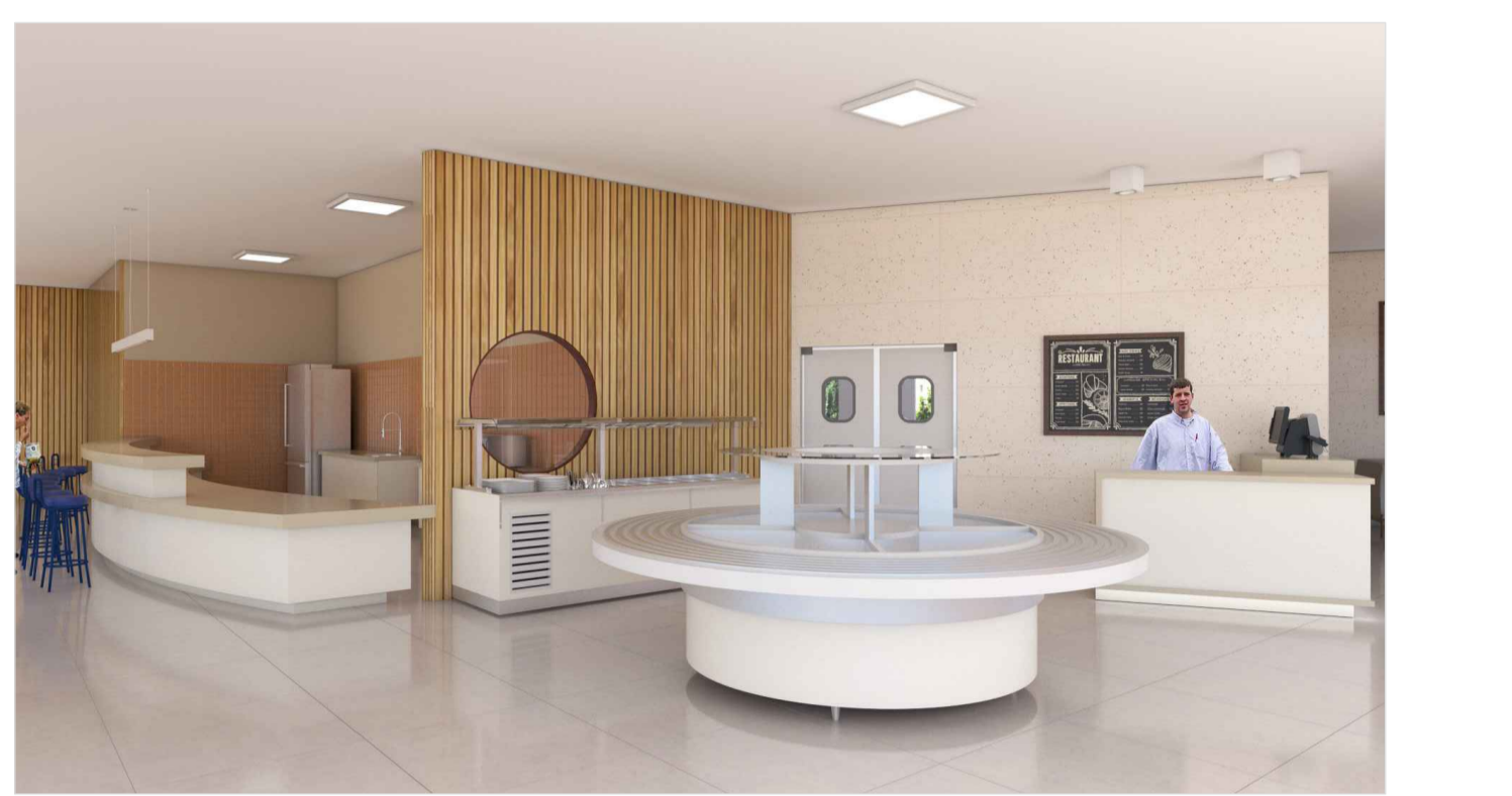
VISTA 3D - BUFFET